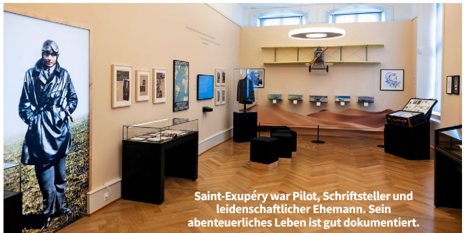
Saint-Exupéry war Pilot, Schriftsteller und leidenschaftlicher Ehemann. Sein abenteuerliches Leben ist gut dokumentiert.

emigrierte in die USA, wo er die Regierung zum Eintritt in den Krieg zu motivieren versuchte.