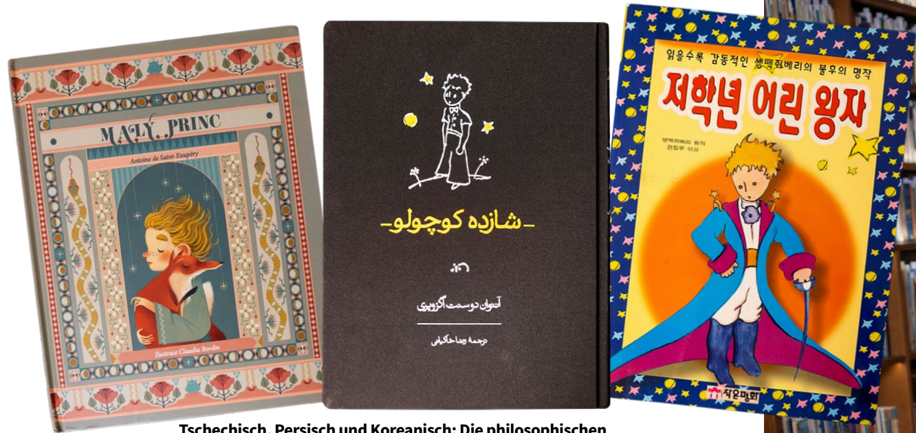
Tschechisch, Persisch und Koreanisch: Die philosophischen Gedanken des Kleinen Prinzen berühren Menschen auf der ganzen Welt.